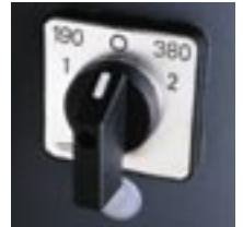
Duo Speed: Hauptschalter