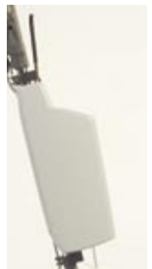
PowerDisc 160: Laugentank als Zubehör