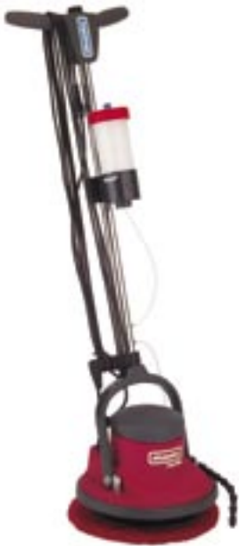
Bild mit Sonderzubehör

Diese äusserst handliche, nur 33 cm breite Einscheibenmaschine wurde speziell für kleine Flächen, sowie Treppen entwickelt. Ob reinigen oder polieren, ob Parkett- oder Steinböden, Sie werden optimalste Ergebnisse erzielen. Dank oszillierenden Bewegungen ist diese Maschine sehr einfach und mühelos zu führen. Ein mitgeführter Wassertank erleichtert zudem die Dosierung bei Reinigungsarbeiten.