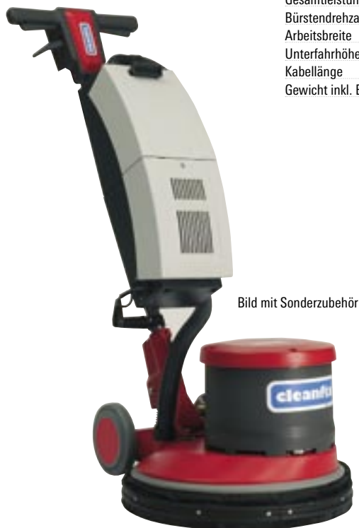
Bild mit Sonderzubehör

Spezialmaschine für die Renovation von Parkettböden und die Kristallisation von Natursteinbelägen. 6-poliger Motor mit verstärktem Drehmoment. Mit Absaugstutzen im Gehäuse für ideale Absaugleistung. Mit Kunststoffgehäuse.