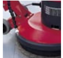
R 44-450: Sprayreinigung