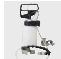
Sprühgerät (Spraymaster) 1 Liter