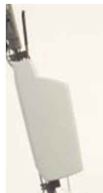
R 44-120 Laugentank als Zubehör