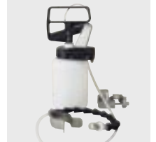
Sprühgerät (Spraymaster) 1 Liter