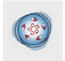
FloorMac: oszillierender Antrieb