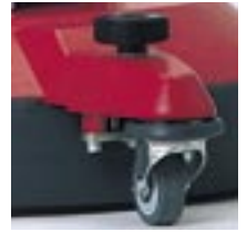
Lenkrolle mit Bürstendruckregulierschraube