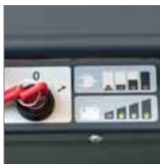
Batterij-indicator/ontlaadindicator. De ontladingsbeveiliging gaat het compleet leegtrekken van de batterij tegen.