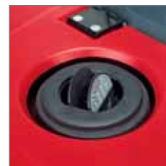
By-pass klep voor het onderbreken van afzuiging bij opzuigen vochtig/nat vuil.