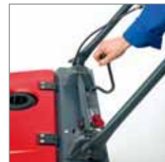
Hendel om de zijborstel omhoog/omlaag te bewegen.