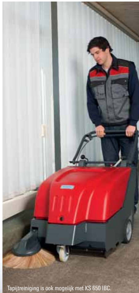
Tapijtreiniging is ook mogelijk met KS 650 IBC.