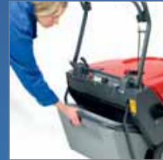
De vuilopvangbak is zeer makkelijk uit te nemen.