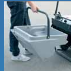
Vuilopvangbak is eenvoudig te dragen.