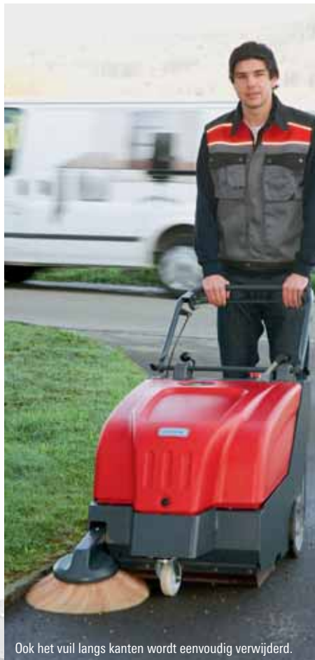
Ook het vuil langs kanten wordt eenvoudig verwijderd.