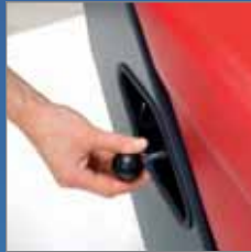
Het reinigen van de filter door het op en neer bewegen van de hendel.