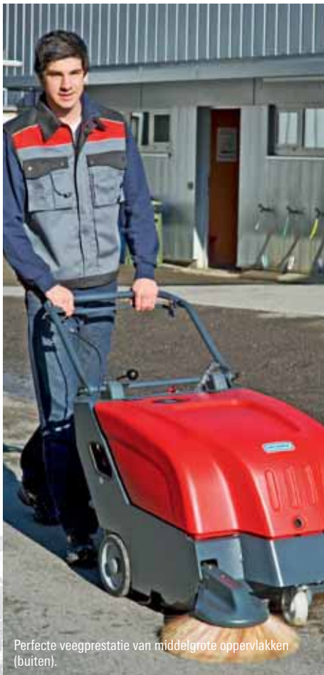
Perfekte veegprestatie van middelgrote oppervlakken (buiten).