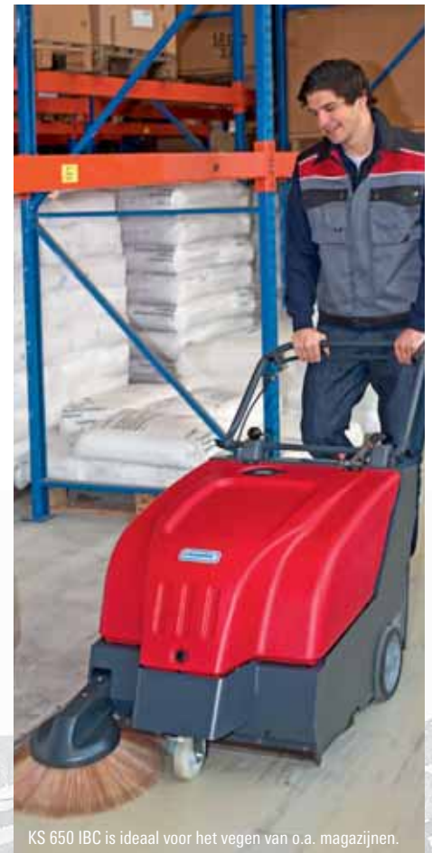
KS 650 IBC is ideaal voor het vegen van o.a. magazijnen.