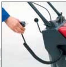
Eenvoudig opladen van de batterij met het geïntegreerde laadapparaat.