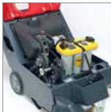
De binnenkant van de machine.