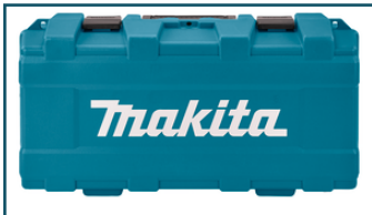
Koffer kunststof (1 stuks) - 821777-2 - 8720023005852