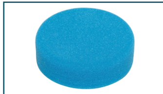
Spons blauw hard grof 150mm (1 stuks) - P-21733 - 0088381948838