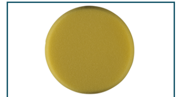
Spons geel hard grof 150mm (1 stuks) - D-74653 - 0088381588300

Dit is slechts een kleine greep uit het ruime assortiment. Kijk voor alle accessoires/verbruiksartikelen in de Catalogus of op www.makita.nl .