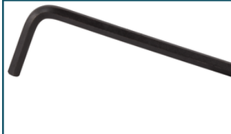
Inbussleutel 5,0mm (1 stuks) - 783203-8 - 0088381102674