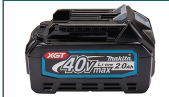
Accu BL4020 XGT 40V Max 2,0Ah (1 stuks) - 191L29-0 - 0088381574549