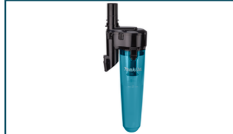
Cyclon voorafscheider zwart (1 stuks) - 191D73-9 - 0088381556644