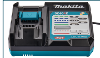
Standaardlader XGT DC40RC (1 stuks) - 191M90-3 - 0088381579261