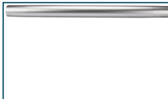
Zuigbuis aluminium (1 stuks) - 199844-4 - 0088381541909

Dit is slechts een kleine greep uit het ruime assortiment. Kijk voor alle accessoires/verbruiksartikelen in de Catalogus of op www.makita.nl .