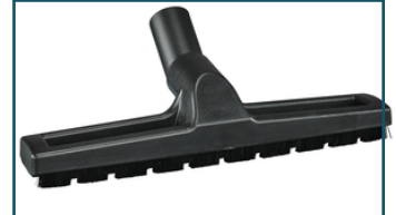
Vloerzuigborstel 32x300Mm (1 stuks) - ACT235 - 8717774542262