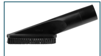
Borstelzuigmond zwart (1 stuks) - 198540-1 - 0088381484404

Dit is slechts een kleine greep uit het ruime assortiment. Kijk voor alle accessoires/verbruiksartikelen in de Catalogus of op www.makita.nl .