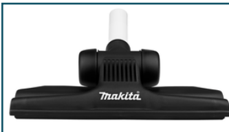
Vloerzuigmond harde vloer&tapijt (1 stuks) - 127082-8 - 0088381541602