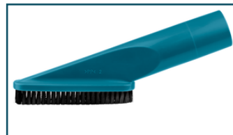
Borstelzuigmond blauw (1 stuks) - 198538-8 - 0088381484381