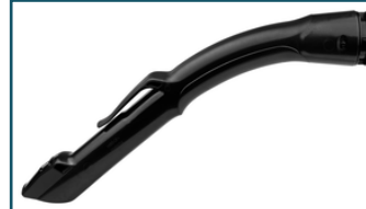
Handgreep zuigbuis kunststof (1 stuks) - 127093-3 - 0088381541619