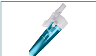
Cycloon voorafscheider wit (1 stuks) - 191D71-3 - 0088381556637