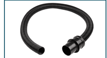
Stofzuigerslang 28x1000mm (1 stuks) - 143787-2 - 0088381485838