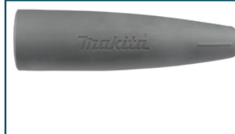
Flexibele zuigmond (1 stuks) - 424841-4 - 3240890497970