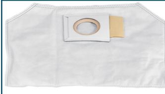
Fleece stofzak ruggedragen stofzuiger (1 stuks) - 197903-8 - 0088381468107