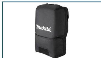
Beschermhoes rugstofzuiger (1 stuks) - 1910S4-7 - 0088381598057