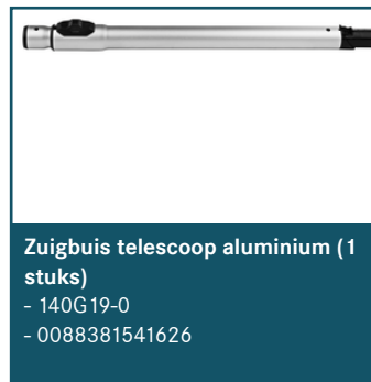
Zuigbuis telescoop aluminium (1 stuks) - 140G19-0 - 0088381541626