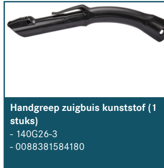
Handgrip zuigbuis kunststof (1 stuks) - 140G26-3 - 0088381584180