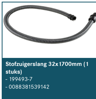
Stofzuigerslang 32x1700mm (1 stuks) - 199493-7 - 0088381539142