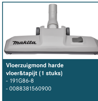
Vloerzuigmond harde vloer&tapijt (1 stuks) - 191G86-8 - 0088381560900