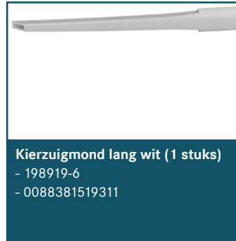
Kierzuigmond lang wit (1 stuks) - 198919-6 - 0088381519311