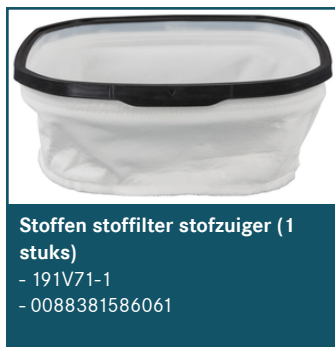
Stoffen stoffilter stofzuiger (1 stuks) - 191V71-1 - 0088381586061

Dit is slechts een kleine greep uit het ruime assortiment. Kijk voor alle accessoires/verbruiksartikelen in de Catalogus of op www.makita.nl .