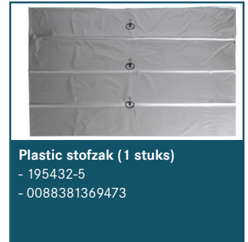
Plastic stofzak (1 stuks) - 195432-5 - 0088381369473