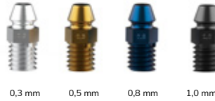
Mondstukken in 4 verschillende formaten 20-150 micron