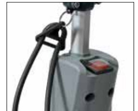
Aan-uitknop en snoersteun