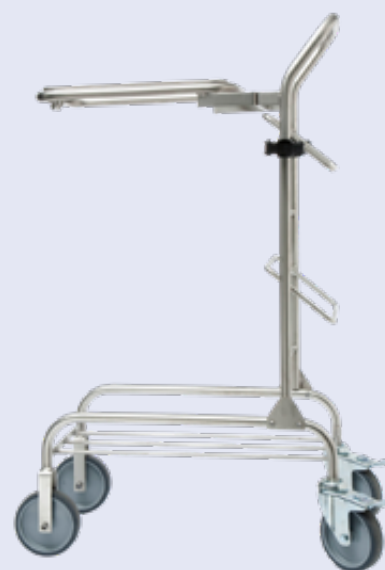
10554509 Clean 'n Easy werkwagen