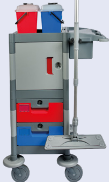
10167149 Brix compact werkwagen