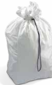
LLT200, 2 x 100L Wasbare linnen zakken

Twin Sax Een compacte, mobiele, dubbele afvalwagen met afsluitdeksels.