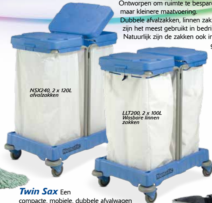
NSX240, 2 x 120L afvalzakken

Dubbele afvalzakken, linnen zakken of waszakken zijn het meest gebruikt in bedrijfsmatige processen. Natuurlijk zijn de zakken ook in combinatie te gebruiken.