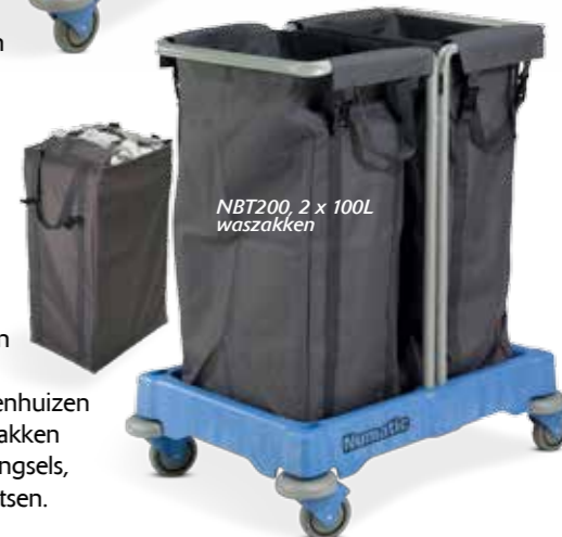
NBT200, 2 x 100L waszakken

Twin Bags Er zijn 101 toepassingen waar mobiele waszakwagens kunnen worden toegepast, bijvoorbeeld in ziekenhuizen en verzorgingstehuizen. De grijze waszakken zijn voorzien van sluitingen en draaghengsels, waardoor ze gemakkelijk zijn te verplaatsen.