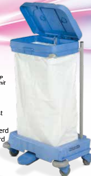
Sax120P Afval unit

Het Numatic Sax afvalstelsel is al langer bekend, maar is nu uitgevoerd met een verbeterd pedaal om de klep te openen. Het systeem met een structufoam basis, Nutex gepoedercoat staal en gemakkelijk systeem voor het wisselen van zakken kan zowel op één plek als mobiel worden ingezet.