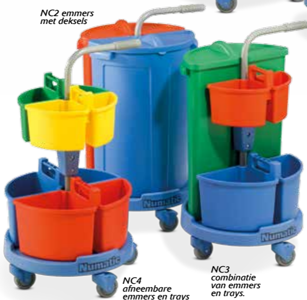
NC4 afneembare emmers en trays