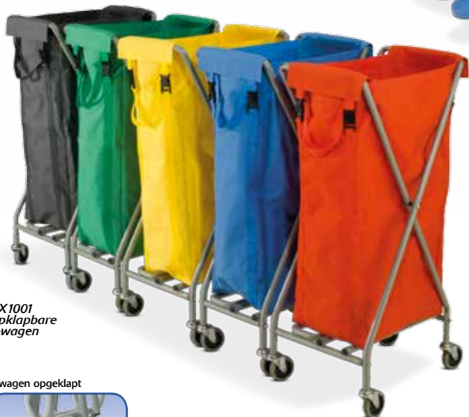
NX1001 Opklapbare X-wagen

De NX1001 is een klassieker van Numatic die al 20 jaar dienst doet en een favoriet is voor velen. Verkrijgbaar in vijf kleuren waszakken voor het gebruik van een eenvoudig kleurgecodeerd systeem, die tevens kunnen worden gebruikt met de standaard 120 liter afvalzakken.