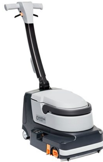
De getoonde afbeelding kan afwijken van het gekozen type

De Nilfisk SC250 is een compacte schrobzuigmachine voor het snel en effectief reinigen van harde vloeren, in elke hoek, zowel vooruit als achteruit en onder meubilair of schappen.