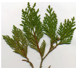
Hout geuren Gericht op heren