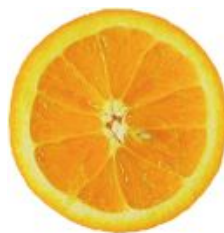
Zoete geuren Fantasia opwekkend