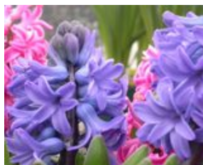
Bloemen geuren Gericht op dames

Ons assortiment van parfumgeuren is onderverdeeld in 4 geurgroepen. In totaal zijn er ruim 40 geuren beschikbaar!