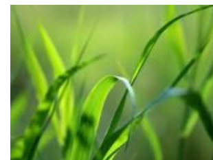
Natuurlijke geuren Frisheid